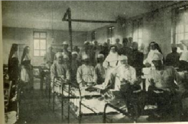
UNE SALLE DU COLLÈGE SAINT-BASILE TRANSFORMÉE EN AMBULANCE ORLÈTES DE L'ASSOMPTION SOIGNANT LES BLESSÉS TURCS