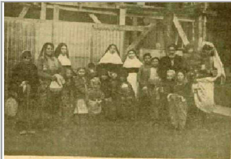
DISPENSIRE DES OBLATES: LES MALADES Y VIENNENT NOMBREUX