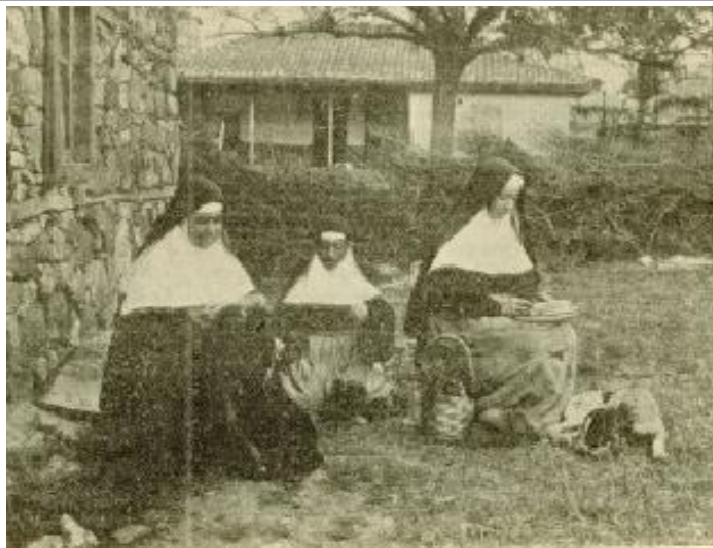
COMMUNAUTÉ DES OBLATES DE L'ASSOMPTION DE MOSTARLI