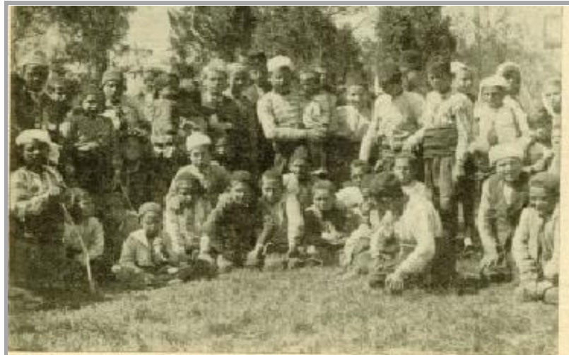
GROUPE DE TZIGANES BULGARES, CLIENTS DES OBLATES INFIRMIÈRES