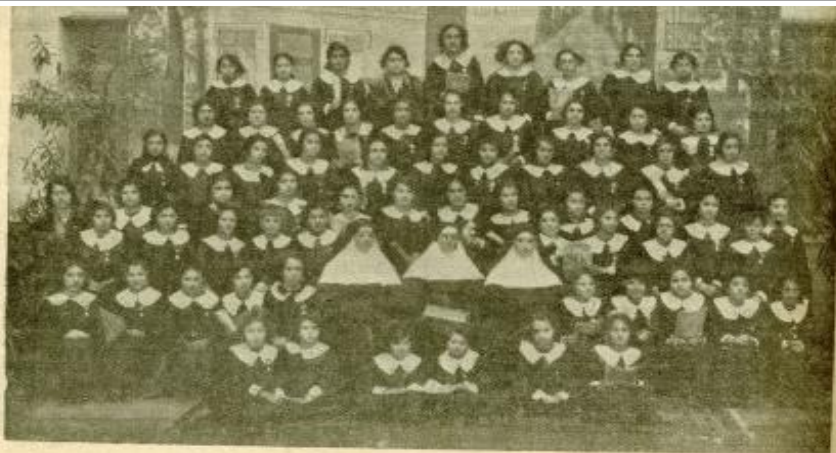
RAIDAR PACHA — UN GROUPE D'ABONNÉES A « L'ÉTOILE NOÛLISTE » AUTOUR DES OBLATES MISSIONNAIRES