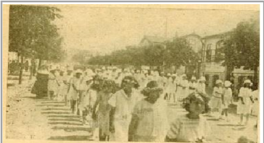
PROCESSION DANS LES RUES DE VARNA — LES ÉLÈVES DE NOS OBLATES