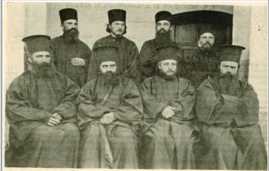
Huit Assomptionistes professeurs du Séminaire slave d'Andrinople.