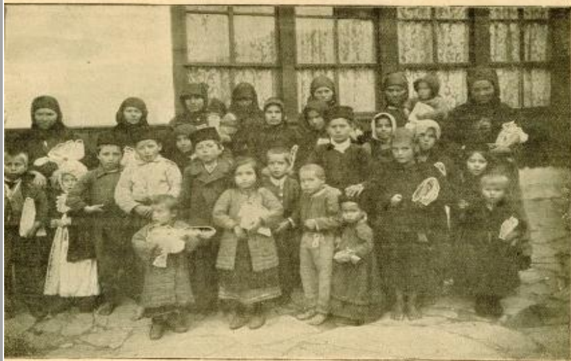
FEMMES ET ENFANTS RÉFUGIÉS EN BULGARIE APRÈS UNE DISTRIBUTION DE VÊTEMENTS CHEZ LES SŒURS OBLATES DE L'ASSOMPTION A YAMBOLI