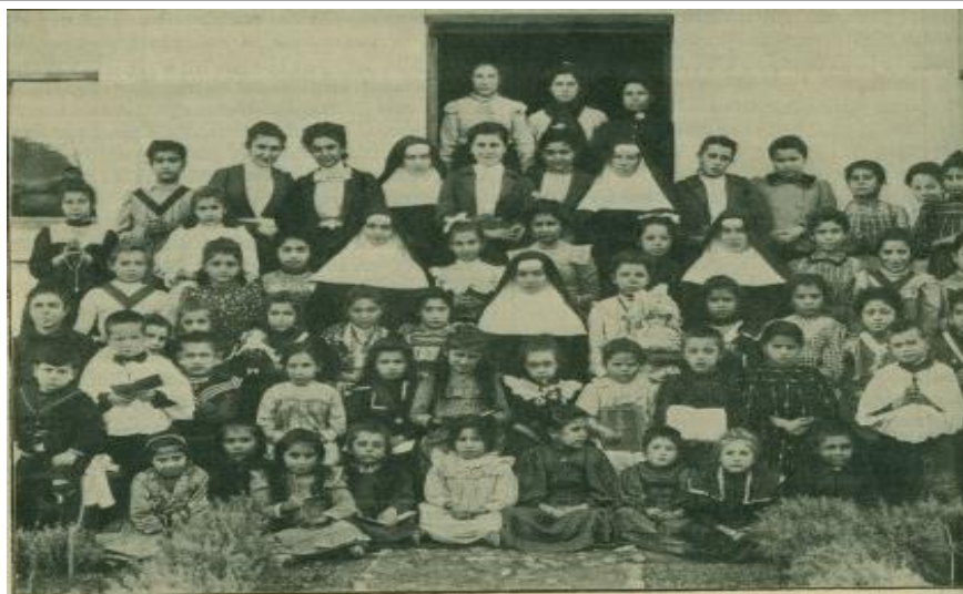
ESKI-CHÉHIR : UN GROUPE DE L'ÉCOLE DE L'IMMACULÉE CONCEPTION