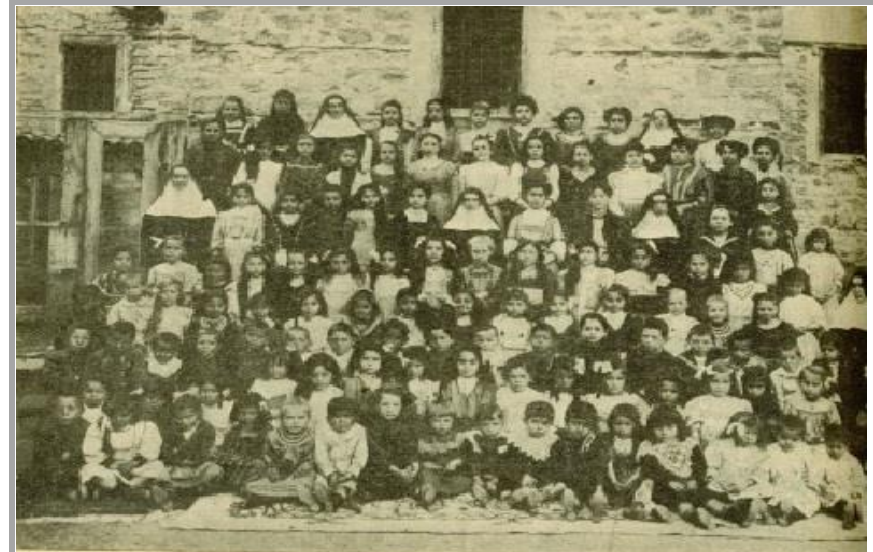
UNE ÉCOLE FRANÇAISE TENUE PAR LES ORLÈTES DE L'ASSOMPTION EN ORIENT