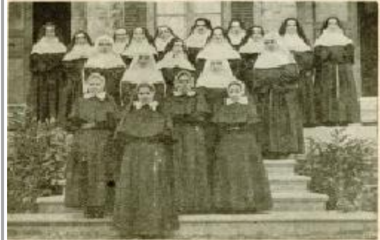
Groupe de novices et de postulantes du noviciat indigène de Phanaraki (1910).