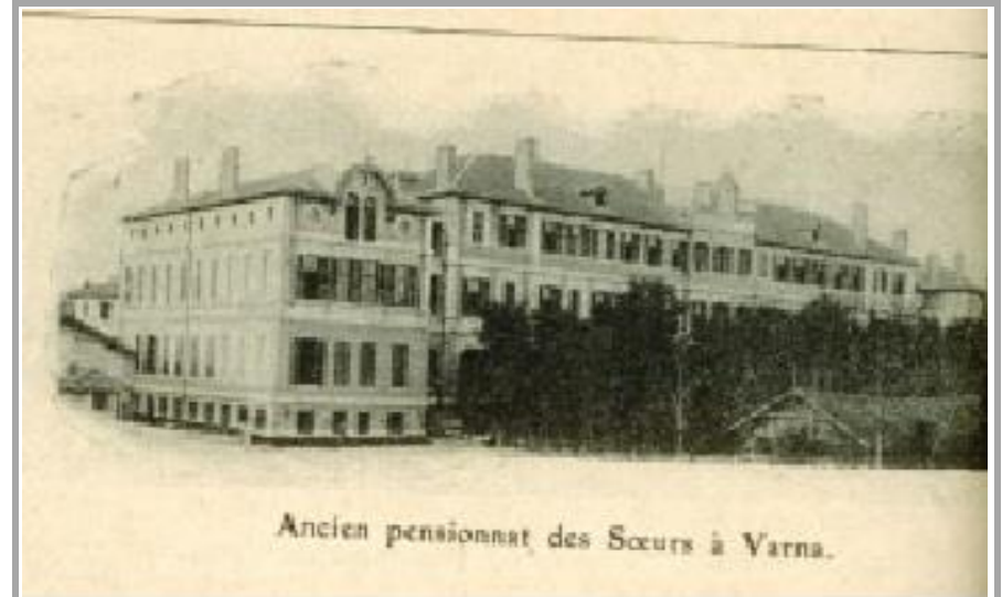
Ancien pensionnat des Sœurs à Varna.