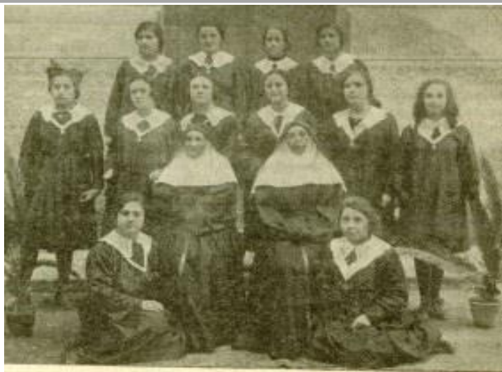
COUM-KAPOU — LES ŒUVRES D'ENSEIGNEMENT PENSIONNAT JEANNE D'ARC: LES ÉLÈVES DE LA PREMIÈRE CLASSE.