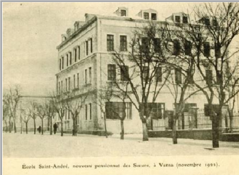
École Saint-André, nouveau pensionnat des Sœurs, à Varna (novembre 1922).